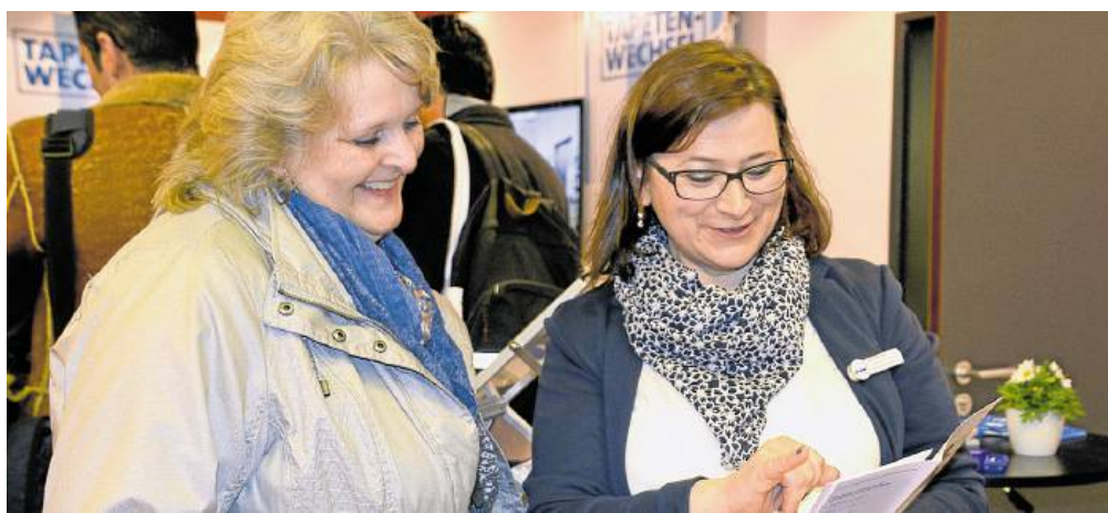
Auf die Besucher der JOBMEDI warten spannende Informationen.

Auf alle Besucher warten spannende Highlights, wie Themendörfer, Vorträge und Lesungen aber auch Gewinnaktionen, die den Messebesuch zu einem erlebnisreichen Event machen. Die Themendörfer sind erstmalig auf der JOBMEDI NRW 2018 zu